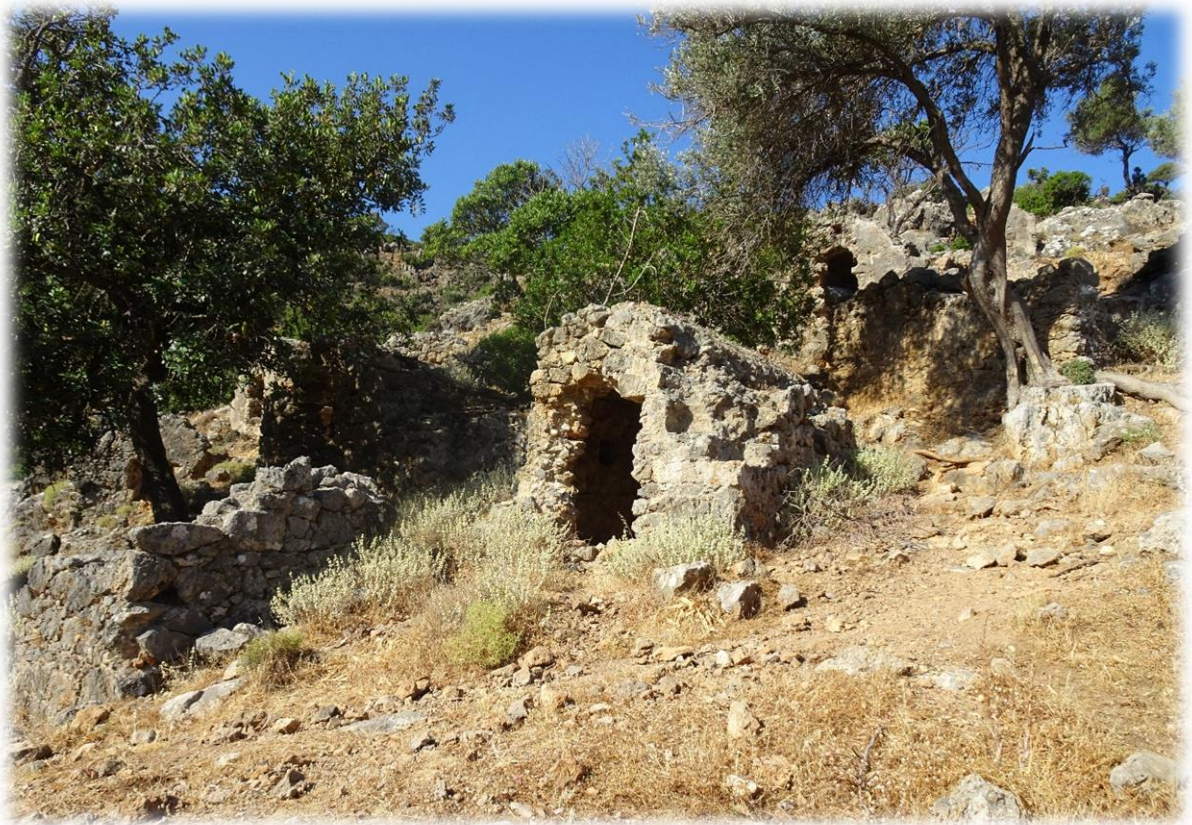
Restanten van oude graftomben zijn nog zichtbaar op een bergflank.