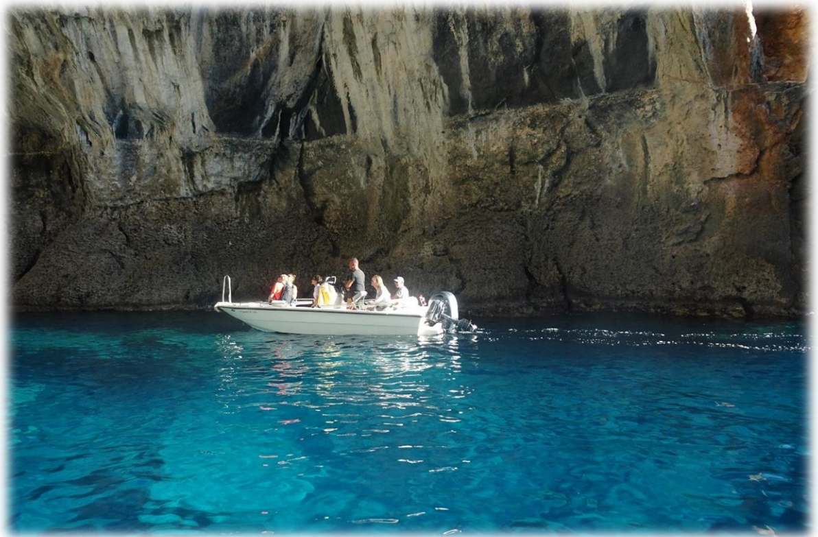
De Blue Lagoon is een natuurlijke grot waar het water een azuurblauwe kleur heeft door de lichtinval.