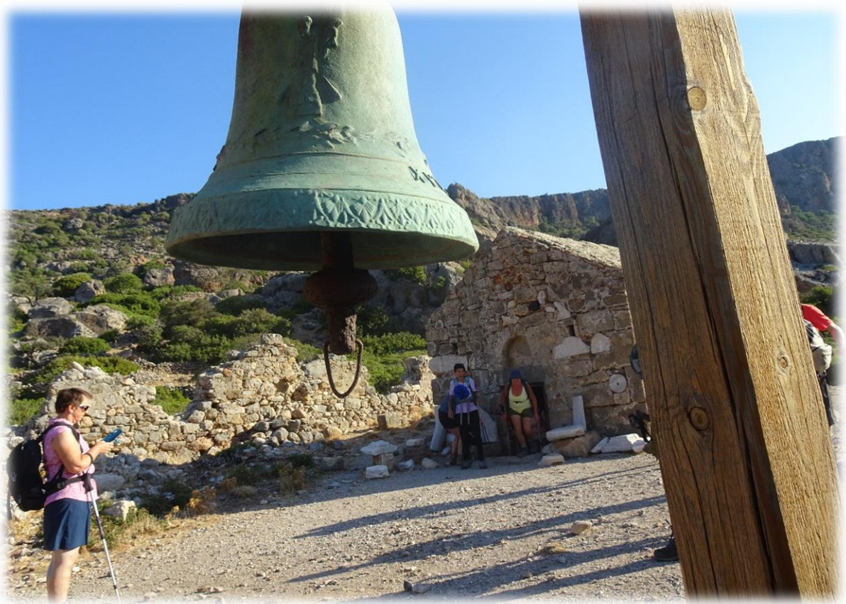
In Lissos werden 20 standbeelden ontdekt waaronder de beroemde standbeelden van Asklepios, de godin Hygeia en Pluto. Alle 20 standbeelden zijn nu te zien in het