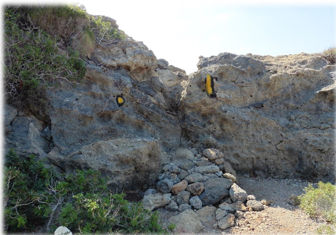
In Kreta wordt de E4 aangeduid met geel-zwarte tekens. Soms zijn het palen, soms zijn het