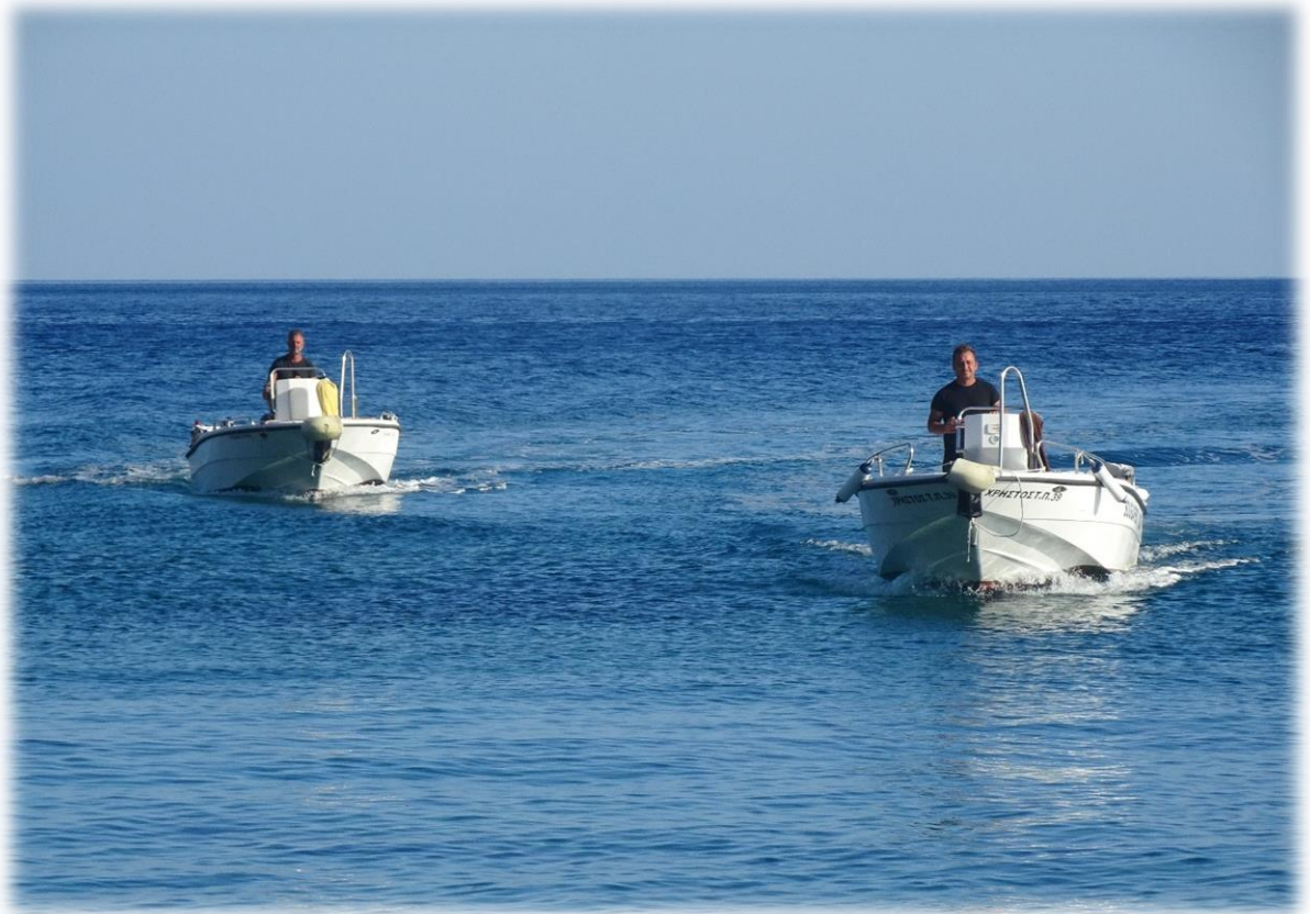
Onze taxi boten komen ons ophalen aan de camping.