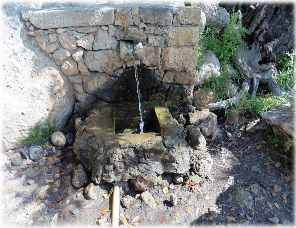
Ook nu nog is er een bron met drinkwater.